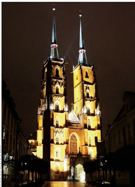
MACIEJ RAJFUR FOTO GOSK