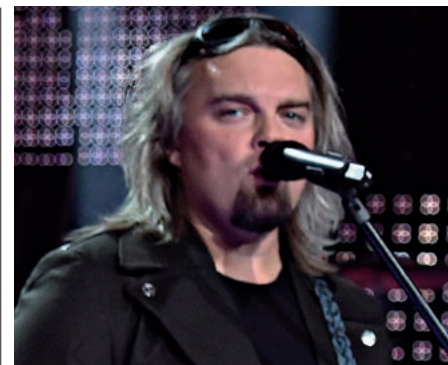
Krzysztof Sobieszuk / PAP